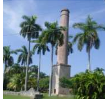
Torre del ingenio Tobia. Marianao