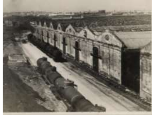
Batería Almacenes de Regla