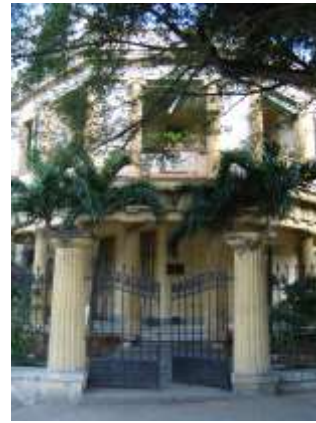
Fundación Fernando Ortiz. Plaza de la Revolución