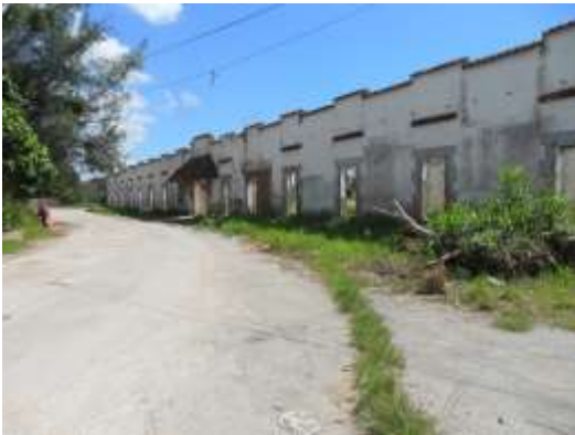
Barracón de esclavos. C Toledo. Marianao