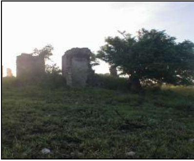
Castillito de Guanabo. Habana del Este Casa Quinta Bello

Algunos sitios Ruta del Esclavo Patrimonio Histórico Azucarero. La Habana.