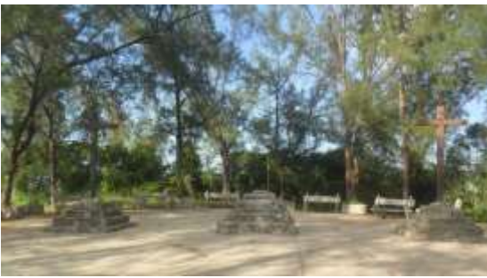
Loma de la Cruz. Cotorro